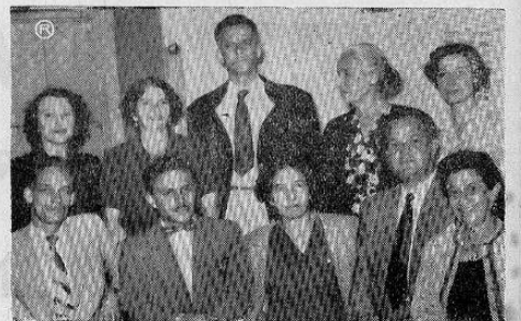
Nuevos directivos de la ANDE para el periodo 1954-1955