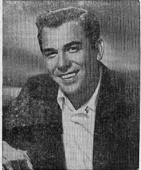
Por M. Betumen